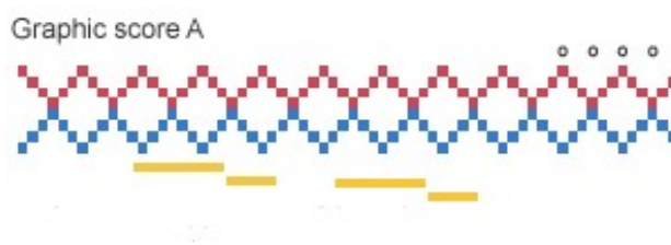
Εικόνα 3. Γραφική παρτιτούρα

1 η διδακτική ώρα: Η 1 η ώρα αφιερώνεται στην προετοιμασία των μαθητών/τριών. Παρουσιάζεται στους/στις μαθητές/τριες το έργο Μεταστάσεις (1953-54) του Ιάνη Ξενάκη ( https://www.youtube.com/watch?v=SZazYFchLRI ). Κατά την ακρόαση του μουσικού έργου, οι μαθητές/τριες παρακολουθούν συγχρόνως από το youtube και την γραφική παρτιτούρα του και ακολουθεί μια σύντομη συζήτηση γύρω από την απεικόνιση των «ηχητικών μαζών» σ’ αυτή τη γραφική παρτιτούρα. Στη συνέχεια ο/η εκπαιδευτικός, μέσα από κατευθυνόμενο διάλογο βοηθά τους/τις μαθητές/τριες να ανακαλέσουν στη μνήμη τους γνώσεις που απέκτησαν στο μάθημα των εικαστικών: τις ιδιότητες (ψυχολογικές) των χρωμάτων, βασικά - συμπληρωματικά χρώματα, θερμά – ψυχρά χρώματα, καθώς και τα είδη των γραμμών και τους τρόπους σύνθεσής τους. Στη συνέχεια δίδεται στους/στις μαθητές/τριες η γραφική παρτιτούρα της Εικόνας 3 (Δημητρακοπούλου κ.ά., 2010).