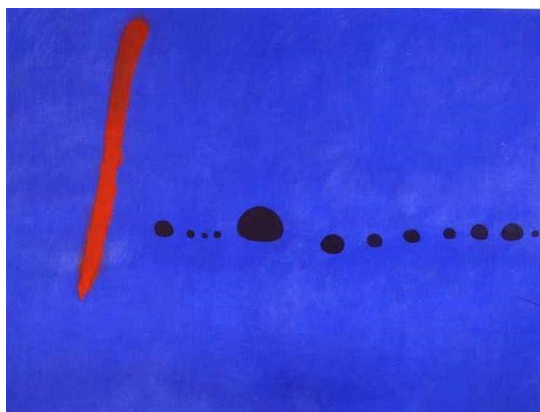
Εικόνα 4. Joan Miró, Blue II , 1961, Musée National d'Art Moderne, Paris.

3 η διδακτική ώρα: Ο/Η εκπαιδευτικός προβάλλει, με χρήση βιντεοπροβολέα, το εικαστικό έργο Blue II του Joan Miró της Εικόνας 4. Αρχικά γίνεται συζήτηση-ανάλυση στην ολομέλεια της τάξης όσον αφορά τις ιδιότητες (ψυχολογικές) των χρωμάτων, τα βασικά - συμπληρωματικά χρώματα, τα θερμά – ψυχρά χρώματα, καθώς και τα είδη των γραμμών και των σχημάτων.